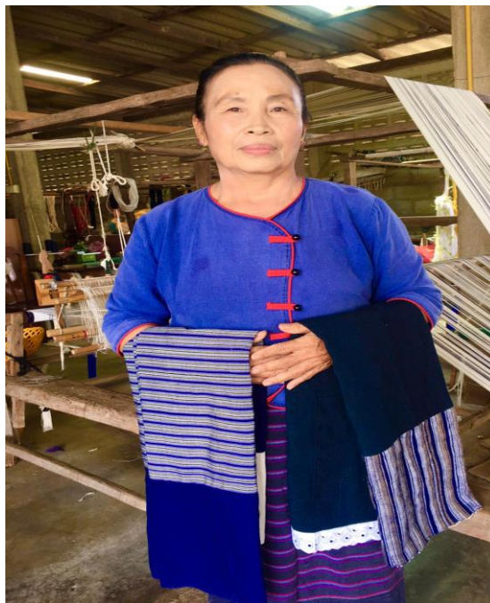
การทอผ้าไทลื้อ