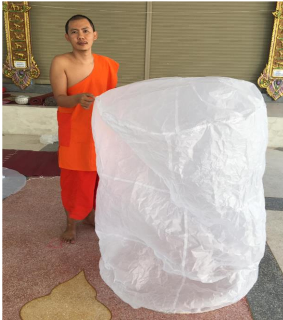
การทำโคมลอย