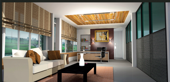
ห้องผู้อำนวยการ

“อยู่ระหว่างดำเนินการก่อสร้าง พร้อมให้บริการเร็วๆ นี้”