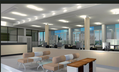
ส่วนสำนักงาน