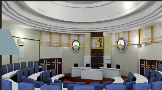
ห้องประชุมสภา