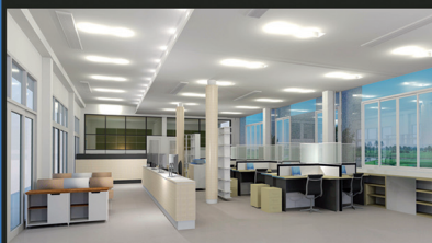
ส่วนสำนักงาน