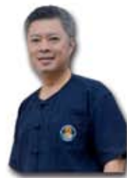
นายก พบประชาชัย