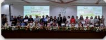
๗ กรกฎาคม ๒๕๖๐ การจัดนิทรรศการการศึกษาาระดับปฐมวัย ณ หอประชุมมหาวิทยาลัยสวนดุสิต (ศูนย์การศึกษานอกที่ตั้งลำปาง)