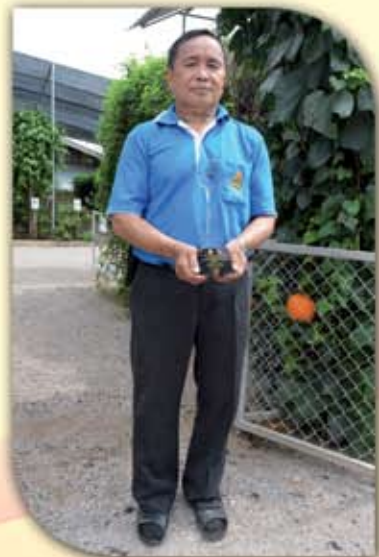
การเตรียมการพิธีที่วัดท่าหมื่นของชมรมเทศบาลนครฉะเชิงเทรา ฉบับประจำเดือน กรกฎาคม - กันยายน ๒๕๖๐