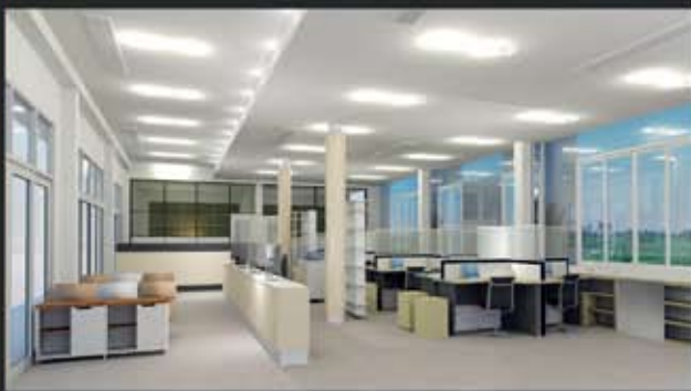
ส่วนสำนักงาน