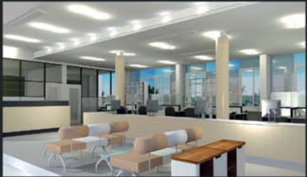
ส่วนสำนักงาน