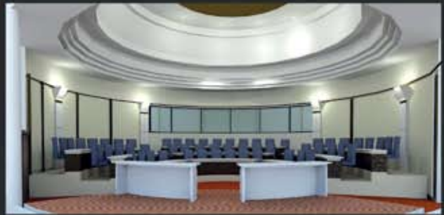
ห้องประชุมสภา