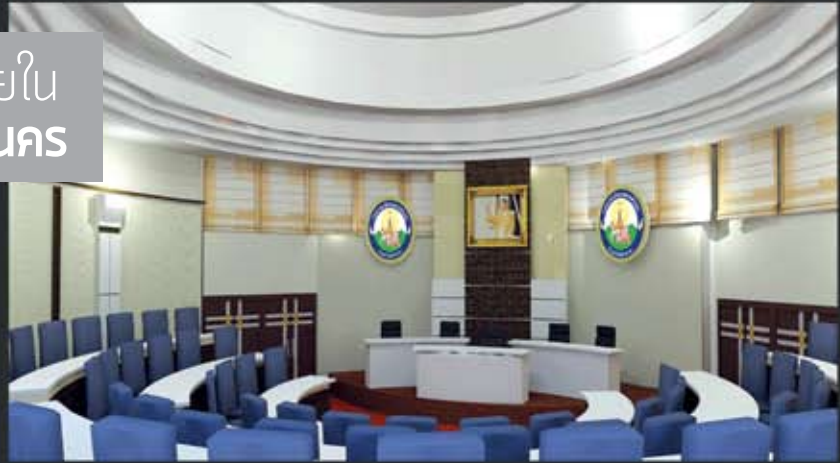
ห้องประชุมสภา