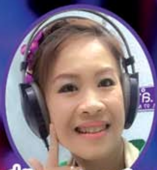
พี่อ้อม สกาวเดือน