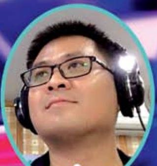
DJ พี่หนุ่ย