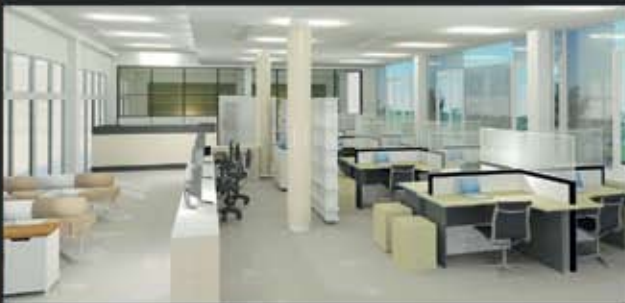
ส่วนสำนักงาน