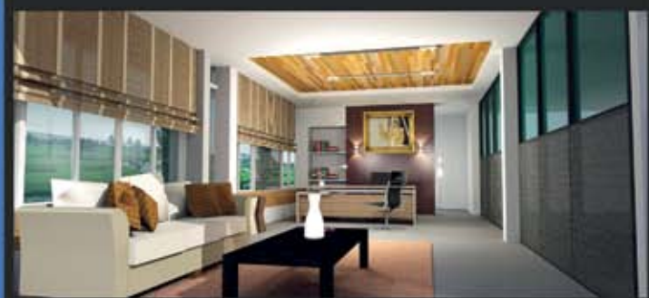
ห้องผู้อำนวยการ

ความคืบหน้าการก่อสร้างอาคารสำนักงานเทศบาลฯ ได้ที่ www.facebook.com/office.kelang